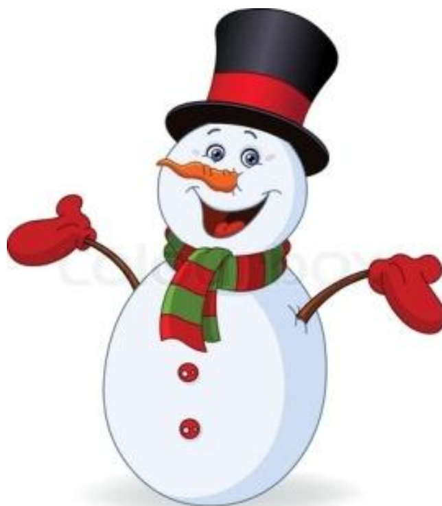
Le bonhomme de neige